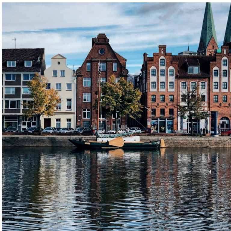
Bürgerhäuser an der Ober-Trave

Breite Straße 89, 23552 Lübeck | niederegger.de